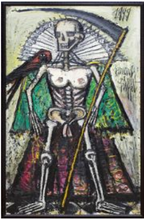
15. La Mort, La Mort 7 , 1999 195 x 114 cm, huile sur toile Museum für Moderne Kunst, Frankfurt am Main © MMK Museum für Moderne Kunst Frankfurt © ADAGP, Paris 2016