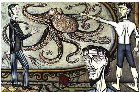
13. Vingt mille lieues sous les mers, Le Poulpe géant, 1989 233 x 309 cm, huile sur toile Collection fonds de dotation Bernard Buffet, Paris © Fonds de dotation Bernard Buffet © ADAGP, Paris 2016