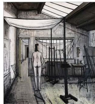
8. Modèle dans l'atelier, 1956 162 x 130 cm, huile sur toile Musée d'art moderne, Troyes © Ville de Troyes, Carole Bell © ADAGP, Paris 2016