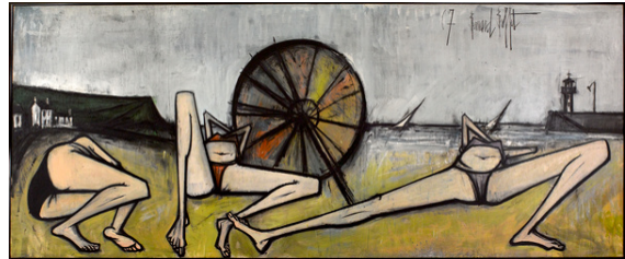
12. Les Plages, Le Parasol, 1967 200 x 524 cm, huile sur toile Musée d'Art moderne de la Ville de Paris © ADAGP, Paris 2016