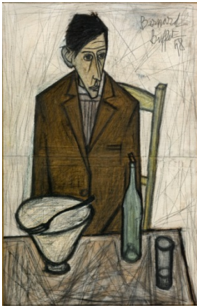
3. Le Buteur, 1948 100 x 65 cm, huile sur toile Musée d'Art moderne de la Ville de Paris