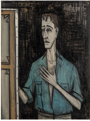
9. Autoportrait sur fond noir, 1956 129,3 x 96,8 cm, huile sur toile Collection Pierre Bergé © Dominique Cohas © ADAGP, Paris 2016