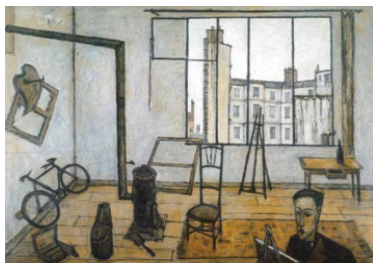
1. L'Atelier , 1947 149 x 200 cm, huile sur toile Musée Bernard Buffet, Surugadaira (Japon) © Musée Bernard Buffet © ADAGP, Paris 2016