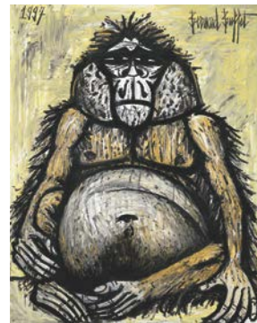
14. Mes singes, Orang-Outan femelle, 1997 162 x 130 cm, huile sur toile Collection fonds de dotation Bernard Buffet, Paris © Fonds de dotation Bernard Buffet © ADAGP, Paris 2016