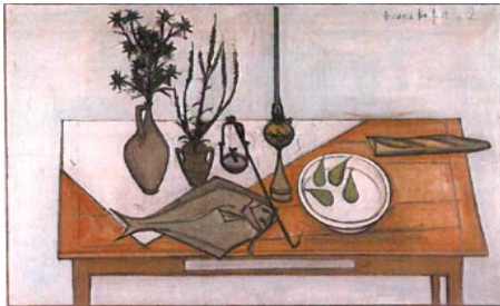
5. Nature morte à la sole, 1952 135 x 224 cm, huile sur toile Collection Pierre Bergé © ADAGP, Paris 2016