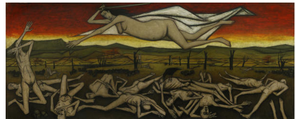
6. Horreur de la guerre, L'Ange de la guerre, 1954 265 x 685 cm, huile sur toile Collection fonds de dotation Bernard Buffet, Paris © Fonds de dotation Bernard Buffet © ADAGP, Paris 2016