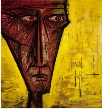
11. Les Écorchés, Tête d'écorché, 1964 146 x 114 cm, huile sur toile Collection fonds de dotation Bernard Buffet, Paris © Fonds de dotation Bernard Buffet © ADAGP, Paris 2016