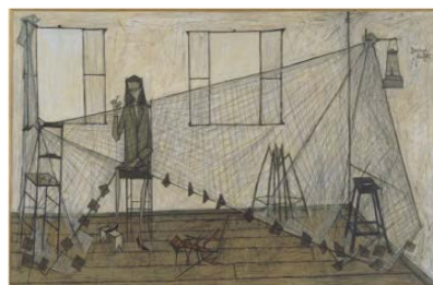
2. La Ravaudeuse de filets , 1948 200 x 308 cm, huile sur toile Musée d'Art moderne de la Ville de Paris © Musée d'Art moderne / Roger-Viollet © ADAGP, Paris 2016