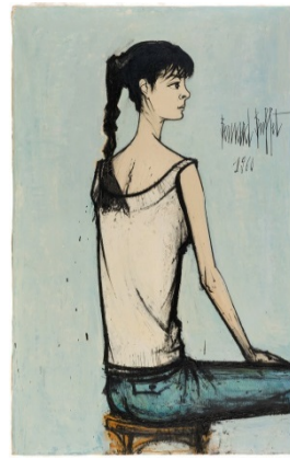
10. Annabel à la natte, 1960 130 x 81 cm, huile sur toile Musée d'Art moderne de la Ville de Paris © ADAGP, Paris 2016