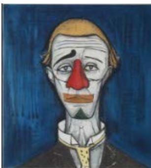
7. Tête de clown, 1955 73 x 60 cm, huile sur toile Collection fonds de dotation Bernard Buffet, Paris © Fonds de dotation Bernard Buffet © ADAGP, Paris 2016