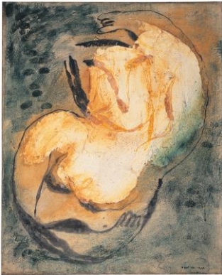
11. Jean FAUTRIER, La Jolie Fille , 1944 Huile, pastel et encre de Chine marouflé sur papier marouflé sur toile 62 x 50 cm Collection particulière © Adagp, Paris, 2017