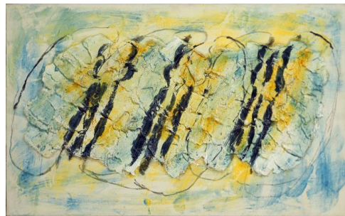
14. Jean FAUTRIER, Les trois têtes , vers 1954 Huile sur papier marouflé sur toile, 38 x 61 cm Collection particulière, Paris, Courtesy Galerie Applicat-Prazan, Paris © Adagp, Paris, 2017