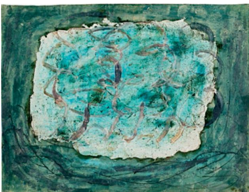
9. Jean FAUTRIER, Forêt (Les Marronniers) , 1943 Huile sur papier marouflé sur toile, 54 x 65 cm Don de l'artiste en 1964 Musée d'Art moderne de la Ville de Paris Crédit photographique : Eric Emo/Parisienne de Photographie © Adagp, Paris, 2017