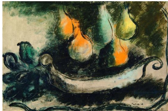
6. Jean FAUTRIER, Poires dans une vasque , 1938 Huile sur papier marouffé sur bois, 60 x 92 cm Collection particulière, Bruxelles, Courtesy Galerie Applicat-Prazan, Paris © Adagp, Paris, 2017