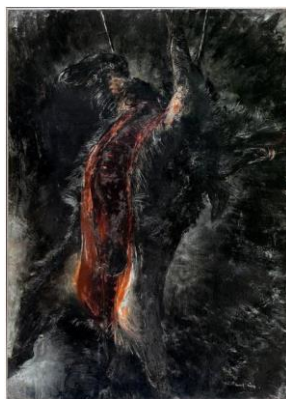
2. Jean FAUTRIER, Le Grand Sanglier noir , 1926 Huile sur toile, 195,5 x 140,5 cm Don de l'artiste en 1964 Musée d'Art moderne de la Ville de Paris