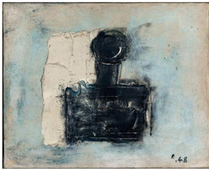
13. Jean FAUTRIER, L'encrier , 1948, Huile sur papier marouflé sur toile, 34 x 41 cm Don René de Montaigu en 1990 Musée d'Art moderne de la Ville de Paris © Adagp, Paris, 2017