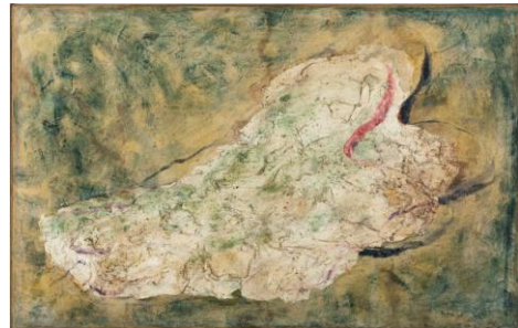
8. Jean FAUTRIER, La Juive , 1943, Huile sur papier marouflé sur toile, 73 x 115,5 cm Don de l'artiste en 1964 Musée d'Art moderne de la Ville de Paris Crédit photographique : Eric Emo/Parisienne de Photographie © Adagp, Paris, 2017