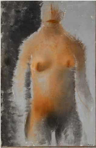
3. Jean FAUTRIER, Nu de face I , vers 1928 Huile sur toile, 100 x 65 cm Collection particulière