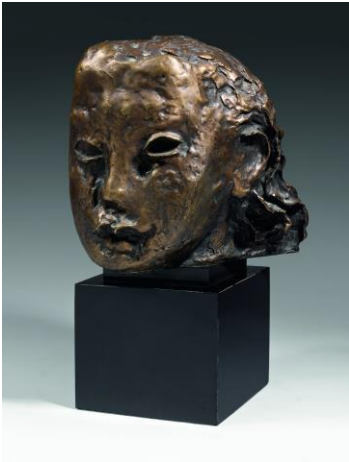
7. Jean FAUTRIER, Jeune Fille au grand front , 1940 Bronze, 18,5 x 16,5 x 19 cm Fondation Beyeler, Riehen/ Bâle Donation Collection Renard Photo : Studio Sebert © Adagp, Paris, 2017