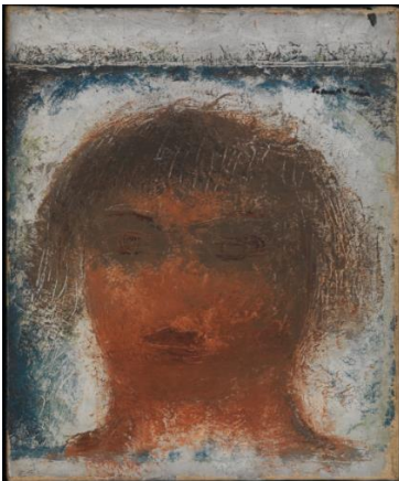
5. Jean FAUTRIER, Tête de femme , vers 1928 Huile sur toile, 32,5 x 27 cm Galerie Haas AG, Zürich Fautrier © Adagp, Paris, 2017