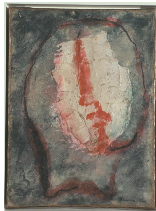
10. Jean FAUTRIER, Tête d'otage n°20 , 1944 Huile sur papier marouflé sur toile, 33 x 24 cm Collection particulière, Cologne © Adagp, Paris, 2017