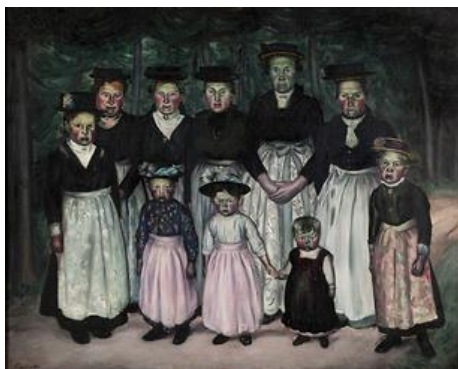
1. Jean FAUTRIER, La Promenade du dimanche au Tyrol ( Tyroliennes en habit du dimanche), 1921-1922 Huile sur toile, 81 x 100 cm Don de l'artiste en 1964 Musée d'Art moderne de la Ville de Paris