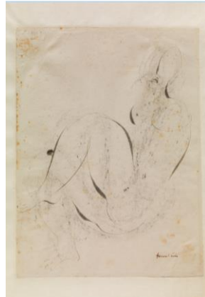
12. Jean FAUTRIER, Dessin de femme pour l'illustration de L'Alleluiah de Georges Bataille , 1947 Encre et fusain sur papier, 24,6 x 20 cm Département des Hauts-de-Seine, Musée du domaine départemental de Sceaux