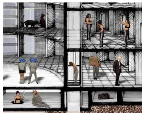
Inci Eviner Parlamento, 2010 HD Data Video 3 minutes ©Inci Eviner