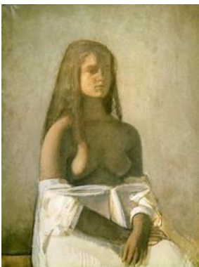
7. Balthus (1908-2001), Jeune Fille à la chemise blanche, 1955 Huile sur toile, 116 x 88,9 cm, Collection of The Pierre and Tana Matisse Foundation