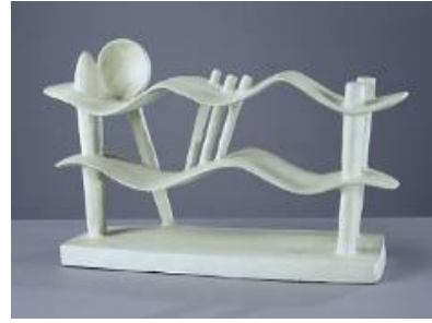
10. Alberto Giacometti (1901-1966), Femme couchée qui rêve, 1929 Bronze peint, 23,5 x 42,6 x 14,5 cm Hirshhorn Museum and Sculpture Garden, Smithsonian Institution, Washington