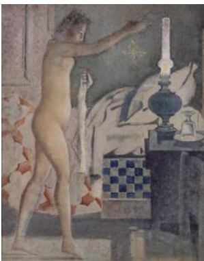
13. Balthus (1908-2001), La Phalène, 1959-1960 Caséine et tempera sur toile, 162 x 130 cm Paris, Centre Pompidou - Musée national d'art moderne - Centre de création industrielle