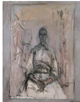
6. Alberto Giacometti (1901-1966), Aïka, 1959 Huile sur toile, 92.0 x 72.8 cm, Fondation Beyeler, Riehen/Basel