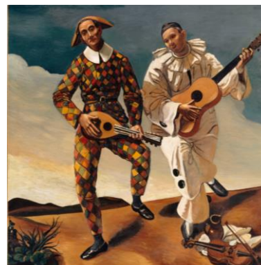
8. André Derain (1880-1954), Arlequin et Pierrot Huile sur toile, 175 x 175 cm, Collection Jean Walter et Paul Guillaume, Paris, musée de l'Orangerie