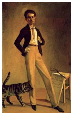
2. Balthus (1908 - 2001), Le Roi des chats, 1935 Huile sur toile, 78 x 49,5 cm Musée cantonal des Beaux-Arts de Lausanne, Suisse. Don de la Fondation Balthus Klossowski de Rola, 2016