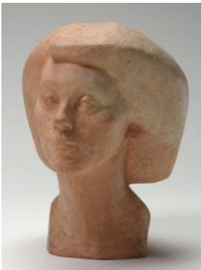
5. Alberto Giacometti (1901-1966), Tête d'Isabel, 1936 Terre cuite, 27,7 x 20,8 x 23,2 cm Hirshhorn Museum and Sculpture Garden, Smithsonian Institution, Washington