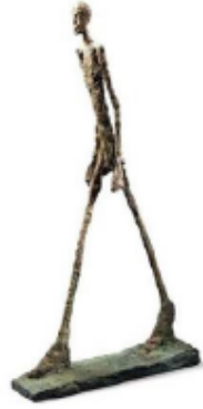
16. Alberto Giacometti (1901-1966), L'Homme qui marche II, 1960, fondu en 1963, Collection Fondation Maeght, Saint-Paul de Vence