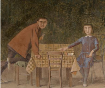
9. Balthus (1908-2001), Les Joueurs de cartes, 1968-1973 Caséine, huile et tempera sur toile, 189 x 226 cm Museum Boijmans Van Beuningen, Rotterdam © Balthus