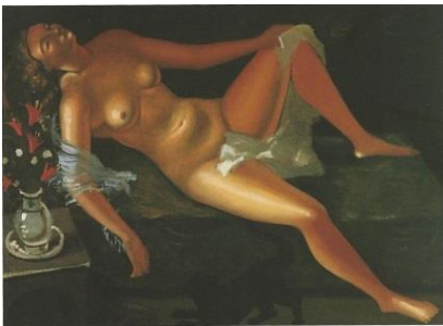
11. André Derain (1880-1954), Nu au chat, 1936-1938 Huile sur toile, 108 x 150,5 cm Hokkaido Museum of Modern Art, Sapporo