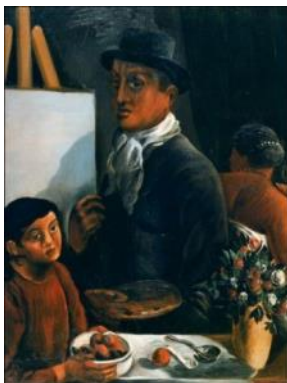
1. André Derain (1880-1954), L'Artiste et sa famille, 1920-21 Huile sur toile, 116 x 89 cm Collection particulière

Ces conditions sont valables pour les sites Internet ayant un statut de presse en ligne étant entendu que pour les publications de presse en ligne, la définition des fichiers est limitée à 1 600 pixels (longueur et largeur cumulées). Les visuels postés sur le net et les réseaux sociaux doivent l'être en basse définition.