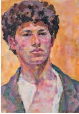
3. Alberto Giacometti (1901-1966), Autoportrait, 1920 Huile sur toile, 41.0 x 30.0 cm Fondation Beyeler, Riehen/Basel. © Succession Alberto Giacometti (Fondation Alberto et Annette Giacometti, Paris & Adagp, Paris), 2017