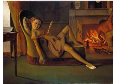
12. Balthus (1908-2001), Les Beaux jours, 1944-1946 Huile sur toile, 148 x 199 cm Hirshhorn Museum and Sculpture Garden, Smithsonian Institution, Washington