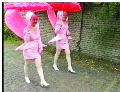
4. Wings I, II, III, 1997/98 installation de 3 vidéos durée : 01:02:32 © VG Bildkunst Bonn / EVA & ADELE, courtesy: Nicole Gnesa Gallery, Munich.