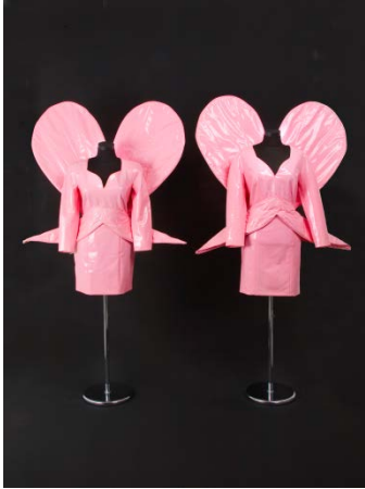
13. Costume des artistes EVA & ADELE, 1992 © VG Bildkunst Bonn / EVA & ADELE, courtesy: Nicole Gnesa Gallery, Munich.