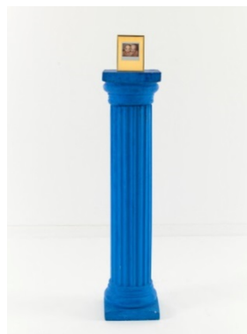
2. Non rien de rien, 1991 installation 165 x 32 x 24 cm © VG Bildkunst Bonn / EVA & ADELE, courtesy: Musée d'Art moderne de la Ville de Paris.