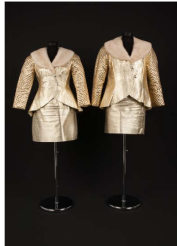
12. Costume des artistes EVA & ADELE, 2000 © VG Bildkunst Bonn / EVA & ADELE, courtesy: Nicole Gnesa Gallery, Munich.