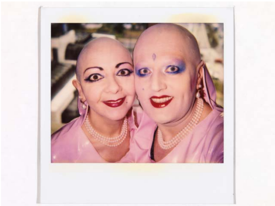
7. Polaroid Diary, 11.02.1993, Madrid