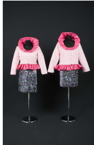
10. Costume des artistes EVA & ADELE, 1993 © VG Bildkunst Bonn / EVA & ADELE, courtesy: Nicole Gnesa Gallery, Munich.