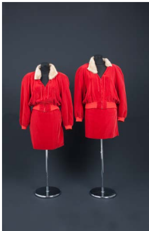
11. Costume des artistes EVA & ADELE, 1991 © VG Bildkunst Bonn / EVA & ADELE, courtesy: Nicole Gnesa Gallery, Munich.