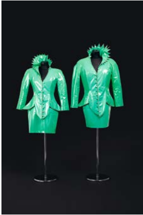
9. Costume des artistes EVA & ADELE, 1994 © VG Bildkunst Bonn / EVA & ADELE, courtesy: Nicole Gnesa Gallery, Munich.