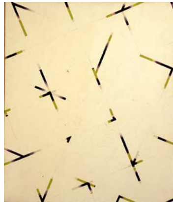
8. The Bird Walker , 1970, acétate de polyvinyle, acrylique, graphite sur toile, Collection privée © Chacal © ADAGP, Paris 2015