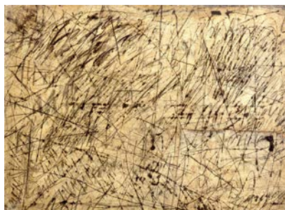
2. Palimpseste dessiné , 1960, acétate de polyvinyle, silice, pigments, collage sur toile, Collection privée © Chacal © ADAGP, Paris 2015