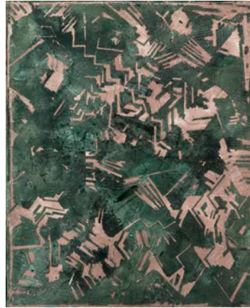
6. Patchwork, lambeaux de vert sur ocre , 1967, acétate de polyvinyle, silice, pigments sur toile, Musée d'Art moderne de la Ville de Paris © Eric Emo / Musée d'Art moderne / Roger-Viollet © ADAGP, Paris 2015