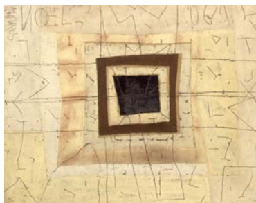
4. Naissance de formes engendrées par des signes , 1961, acétate de polyvinyle, silice, pigments sur toile, Collection privée © Chacal © ADAGP, Paris 2015