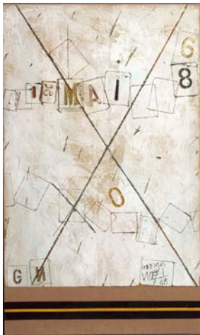
7. Computer , 1968, acétate de polyvinyle, silice, pigments sur toile, Collection privée © Chacal © ADAGP, Paris 2015