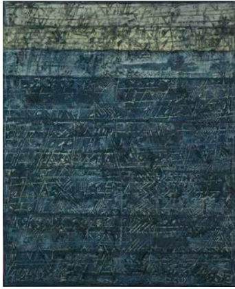
5. Palimpseste le soir , 1965, acétate de polyvinyle, silice, pigments sur toile, Musée d'Art moderne de la Ville de Paris © ADAGP, Paris 2015