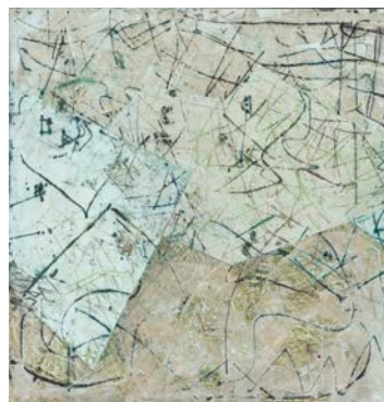
10. Patchwork , 1990, acétate de polyvinyle, silice, pigments sur toile, Musée d'Art moderne de la Ville de Paris © Eric Emo / Musée d'Art moderne / Roger-Viollet © ADAGP, Paris 2015