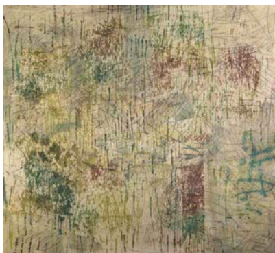
9. La pluie Edo , 1990, acétate de polyvinyle, silice, pigments sur toile, Collection privée © Chacal © ADAGP, Paris 2015