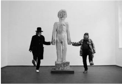
3. A. R. Penck et James Lee Byars avec une sculpture de Baselitz, Galerie Michael Werner, Cologne, 1983 23,7 x 30,5 cm