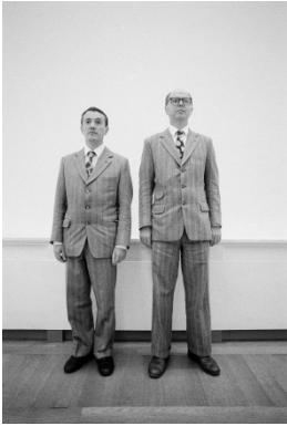
7. Gilbert & George, Bâle, 28.09.1986 30,2 x 23,8 cm