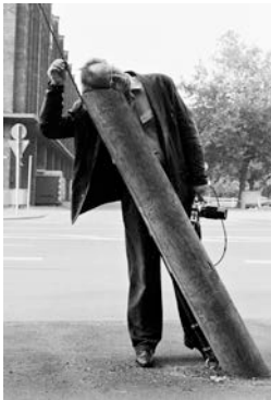
5. Sigmar Polke, Cologne, 1984 49,5 x 39,7 cm © ADAGP, Paris 2016