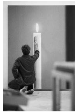
4. Gerhard Richter dans son atelier en train de réaliser „Die Kerze“ (La bougie), Cologne, 1983 40,4 x 30,5 cm © ADAGP, Paris 2016