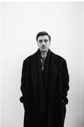
9. Albert Oehlen, Krefeld, 1987 18,3 x 12,7 cm © ADAGP, Paris 2016