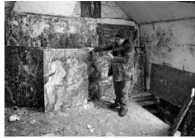
6. Eugène Leroy dans son atelier à Wasquehal, France, 1985 24 x 30,4 cm