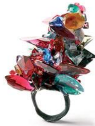
6. Karl Fritsch, Bague , 2006 Argent oxydé, pierres fines Collection Ville de Cagnes-sur-Mer © Karl Fritsch © Collection Ville de Cagnes-sur-Mer