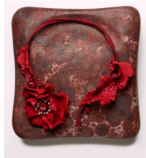
10. Victoire de Castellane, Collier et son support Opiom Velourosa Purpra , 2010