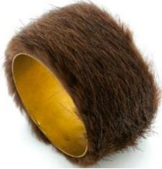
3. Meret Oppenheim, Bracelet, 1935 Fourrure, métal. Pièce unique. Paris, collection particulière © Meret Oppenheim © ADAGP, Paris 2017