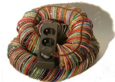
13. Bless, Multicoloured Bangles, 2005

Câble électrique gainé de bracelets multicolores, avec bloc multiprise/ballon de football 4 prises, plastique, métal, laine