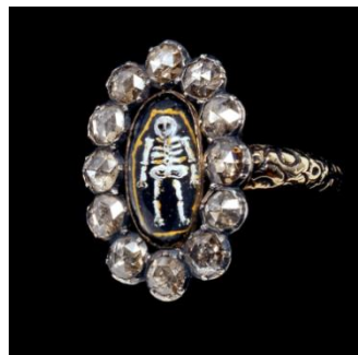
8. Anonyme, Bague Memento Mori , vers 1730 Argent, or, émail, cristal de roche Collection Katharina Faerber