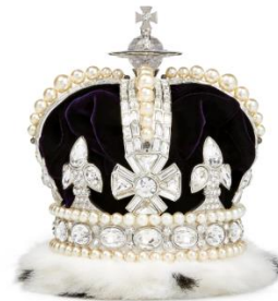
14. Vivienne Westwood Crown, Royal Blue Velvet Jewelled Crown With Orb and Fur, collection « Gold Label », automne/hiver 2000-2001