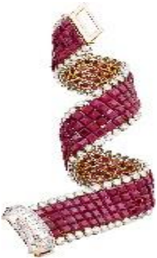
5. Van Cleef & Arpels, Bracelet Ruban , 1959 Platine, or jaune, Serti Mystérieux rubis, diamants Collection Van Cleef & Arpels