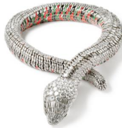
4. Cartier Paris, Collier Serpent , commande de 1968 Platine, or blanc et or jaune, 2 473 diamants taille brillant et baguette pour un poids total de 178,21 carats, deux émeraudes de forme poire (yeux), émail vert, rouge et noir