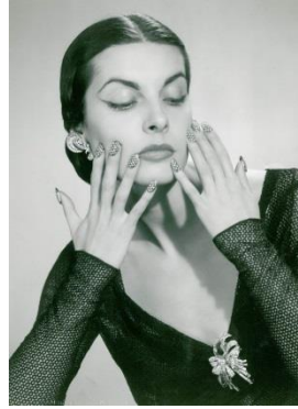
16. Faux ongles en palladium et diamants, brevet déposé par Mellerio en 1953 Collection Mellerio