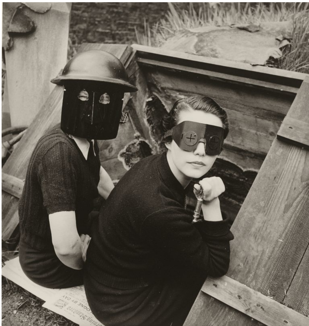
Lee Miller, Femmes équipées de masques anti-feu Fire Masks Downshire Hill, Londres 1941 © Lee Miller Archives England 2026 All Rights Reserved