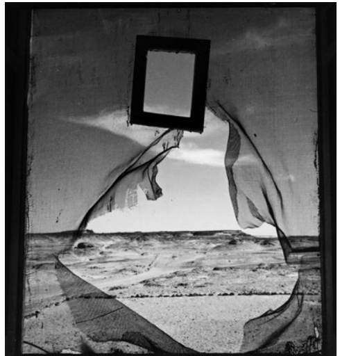
Lee Miller Portrait de l'espace Portrait of Space Al Bulwayeb, près de Siwa, Égypte 1937