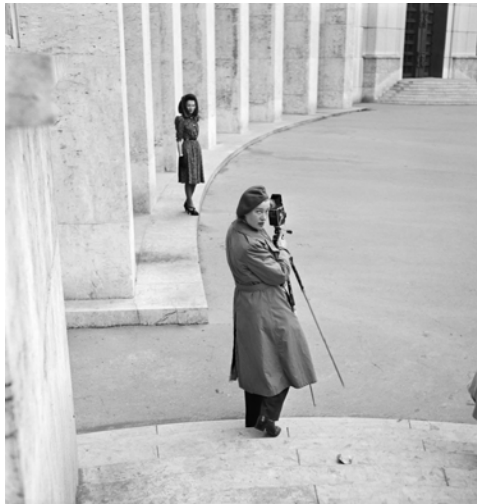
Lee Miller avec son appareil lors d'une séance photo Schiaparelli pour Vogue Lee Miller with camera on a Schiaparelli fashion assignment for Vogue Musée d'Art Moderne, Paris, 1945