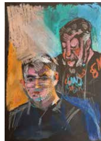
Atelier portrait pour les participants du groupe CASP EMMAÛS