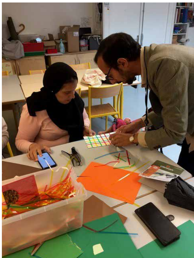
Une femme venue avec le Centre d'Action Social Protestant (CASP) réalise un atelier « Albers »