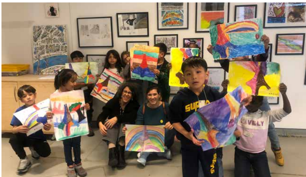
Les enfants du Centre d'Hébergement d'Urgence pour Mineurs d'Ivry (CHUM)