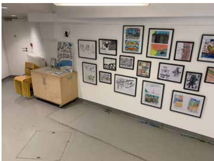
Exposition des œuvres des détenus, lors de la restitution de « Street Paris » dans l'atelier du MAM.

collages, lettrages, carnets de bord ont été collectés afin que chacun puisse témoigner de son rapport particulier à la ville, qu'il soit personnel ou collectif, historique ou imaginaire. Une restitution s'est tenue dans les ateliers pédagogiques du musée d'Art moderne, présentant une exposition des œuvres des participants et la projection d'un petit film d'animation, mixant les voix des détenus avec leurs dessins, leurs peintures et leurs plans. Des échanges avec des prisonniers, ayant obtenus une autorisation de sortie, ont eu lieu à cette occasion.