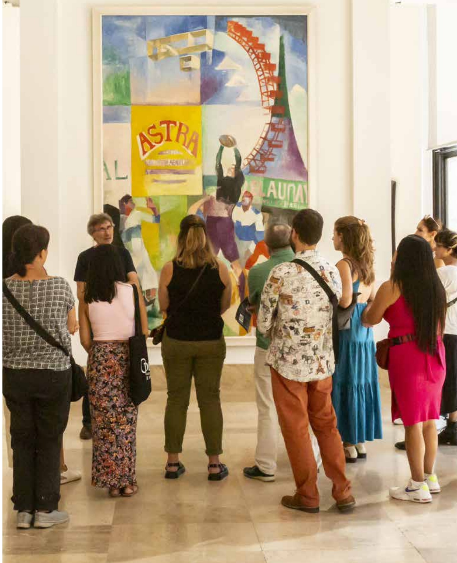
Des étudiants venus de tous les continents, inscrits en cours de FLE (Français Langue Etrangère) à l'alliance Française IDF, suivent une conférence dans les collections.