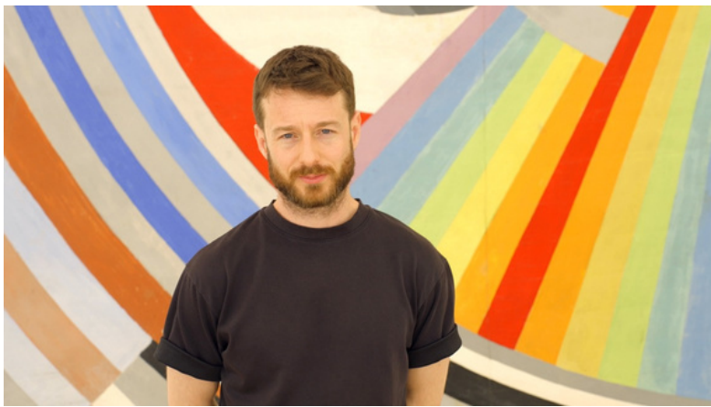
Oliver Beer

Oliver Beer a suivi une formation en composition musicale avant d'étudier à la Ruskin School of Art de l'université d'Oxford, puis la théorie cinématographique à la Sorbonne, à Paris. Cette double formation se reflète dans ses performances, films, installations, peintures et sculptures, où il explore le potentiel unificateur de la musique résonnant à travers l'histoire, les générations et les cultures. Ses œuvres abordent des thèmes à la fois intimes et universels, tels que la transmission des souvenirs musicaux ou les significations personnelles et collectives investies dans les objets matériels et culturels. Son travail a fait l'objet de nombreuses expositions individuelles et collectives, notamment au Met Breuer, au Metropolitan Museum of Art et au MoMA PS1 à New York ; au Centre Pompidou, à la Fondation Louis Vuitton, au Palais de Tokyo et au Château de Versailles ; ainsi qu'aux biennales de Sydney, d'Istanbul et de Venise. Son travail était récemment présenté à la 17 e Biennale de Lyon.