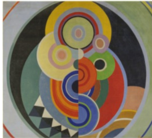
Sonia DELAUNAY (1885 - 1979) Rythme, 1938 Huile sur toile 536 x 595 cm Collection MAM Paris