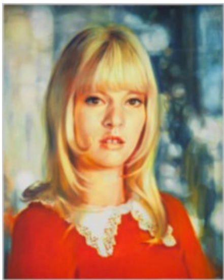
Nina CHILDRESS (1961-) Sylvie (grosse tête) , 2018 Huile sur toile 250 x 200 cm Collection MAM Paris