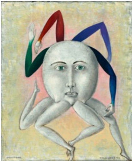
Victor BRAUNER (1903-1966) Stéréofigure, 1959 Huile sur toile 73 x 60 cm Collection MAM Paris