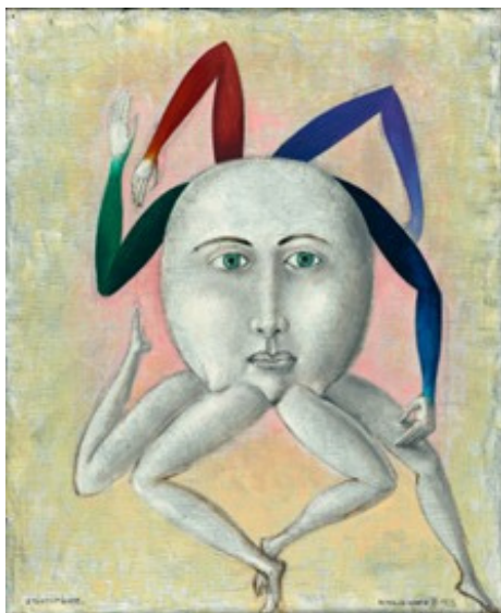
Victor BRAUNER (1903-1966) Stéréofigure, 1959 Huile sur toile 73 x 60 cm Collection MAM Paris