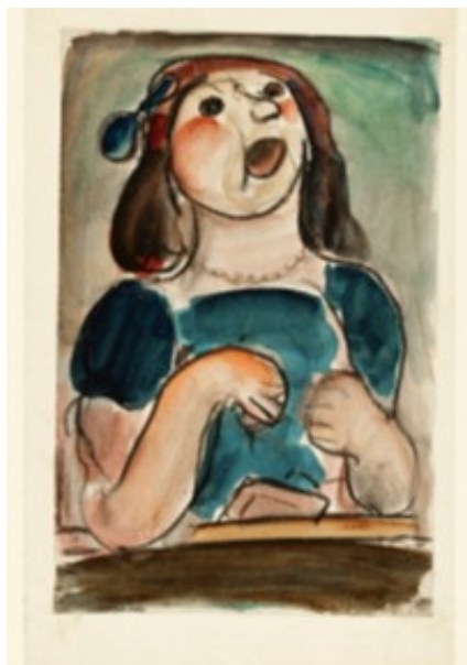
Georges ROUAULT (1871 - 1958) Buste de chanteuse de face, 1902 - 1914 Huile délayée à l'essence, fusain et aquarelle sur papier 31,2 x 20,5 cm Collection MAM Paris