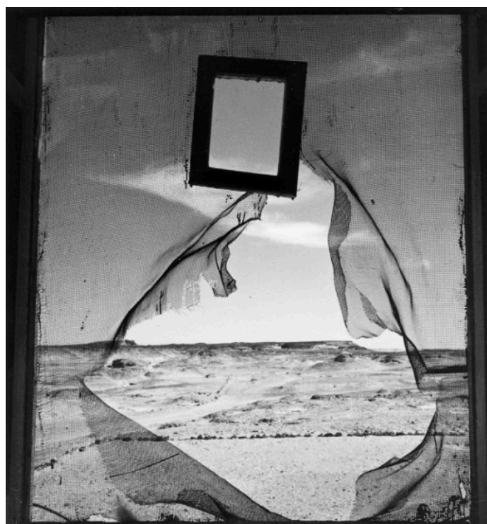
Lee Miller, Portrait de l'espace , Al Bulwayeb, près de Siwa, Égypte, 1937.