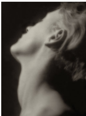
Man Ray et Lee Miller, Cou (Lee Miller), Paris, 1929 / Man Ray and Lee Miller, Neck (Lee Miller), Paris, 1929

Qui est le-la véritable auteur·rice d'une image ? La personne qui la prend ou celle qui la retouche et la recadre ? Est-ce la capture initiale ou la modification qui fait de la photo une œuvre d'art ? Aujourd'hui, cette œuvre est considérée comme une création conjointe de Lee Miller et Man Ray.