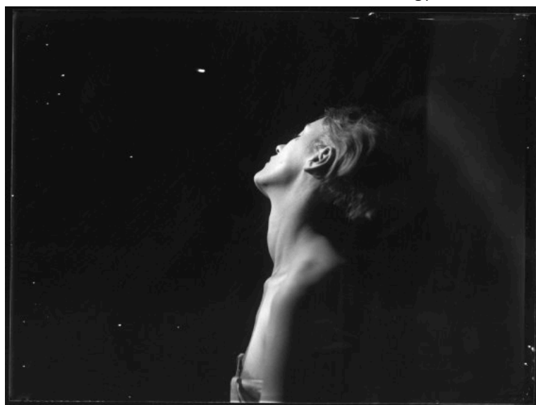
Man Ray, Lee Miller, Paris, 1929

Lee Miller, Dans la chambre noire, Station de bombardiers Lancaster, Lincoln, Royaume-Uni, 1943