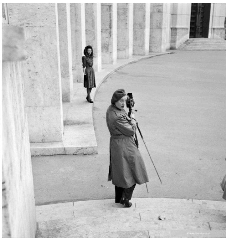
Anonyme, Lee Miller avec son appareil lors d'une séance photo pour Schiaparelli

Après la guerre et ses nombreux photoreportages en zone de conflits, elle n'abandonne ni les shootings pour les grandes maisons de mode ni sa collaboration avec Vogue qui continue jusqu'en 1953.