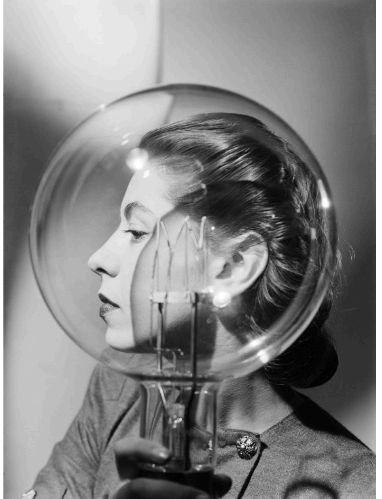
Lee Miller, Modèle avec ampoule , Vogue studio Londres, vers 1943

Dix-huit ans après la dernière rétrospective française au Jeu de Paume, le Musée d'Art Moderne de Paris propose un parcours en six parties, mêlant approche chronologique et thématique.