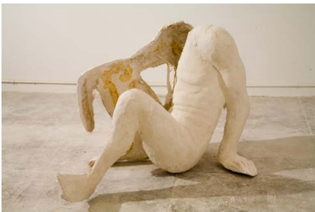
3. Thomas Houseago, Sitting nude , 2006 Tuf-cal, chanvre, fer 137,2 x 94 x 88,9 cm Rubell Family Collection © Thomas Houseago © ADAGP, Paris, 2019