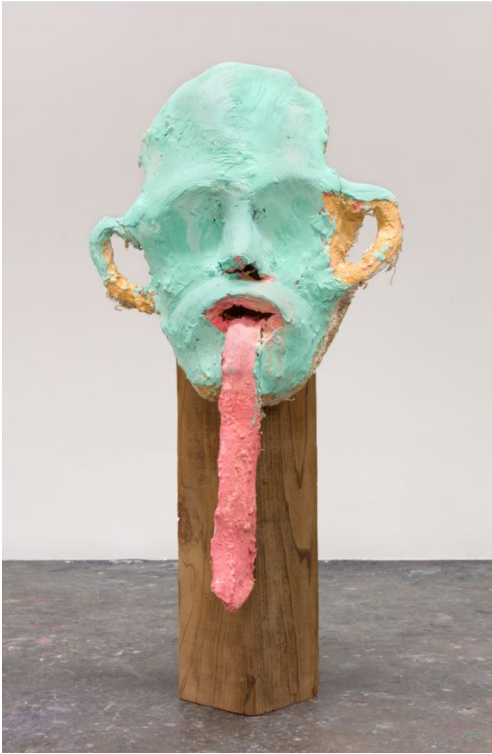
1. Thomas Houseago, Untitled Face (Pink Tongue #2/Green Face) , 1995 Plâtre, peinture acrylique, bois 118 x 60 x 38 cm Courtesy de l'artiste, Los Angeles © Thomas Houseago © ADAGP, Paris, 2019 Photo : Fredrik Nilsen Studio