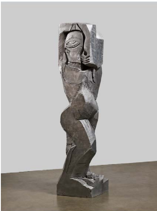
7. Thomas Houseago, Rattlesnake figure (aluminium) , 2011 Aluminium 331,5 x 73,7 x 73,7 cm Collection particulière, Paris © Thomas Houseago © ADAGP, Paris, 2019