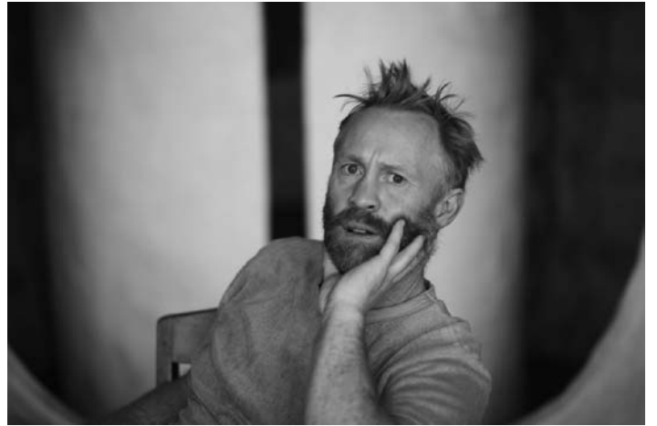
14. Portrait de Thomas Houseago, 2018 © Muna El Fituri