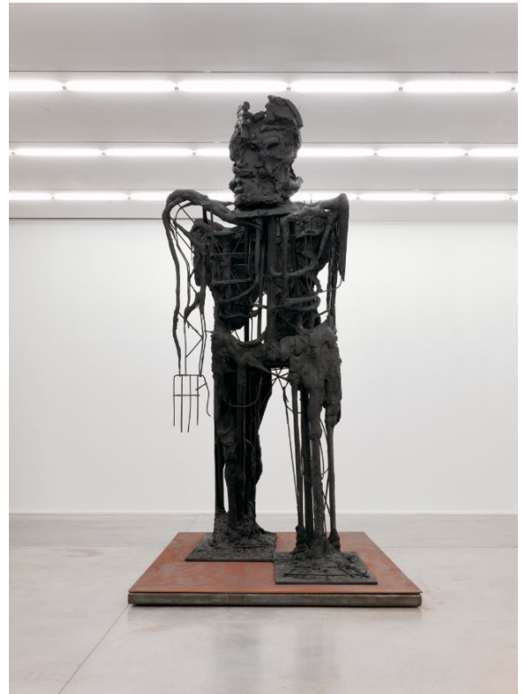
6. Thomas Houseago, Striding Figure II (Ghost) , 2012 Bronze 505,5 x 200,7 x 315 cm © Thomas Houseago © ADAGP, Paris, 2019