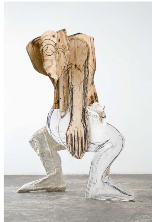
4. Thomas Houseago, Serpent , 2008 Tuf-Cal, chanvre, fer à béton, Oilbar, mine de plomb, bois 244 x 155 x 120 cm Collection Baron Guillaume Kervyn de Volkaersbeke © Thomas Houseago © ADAGP, Paris, 2019