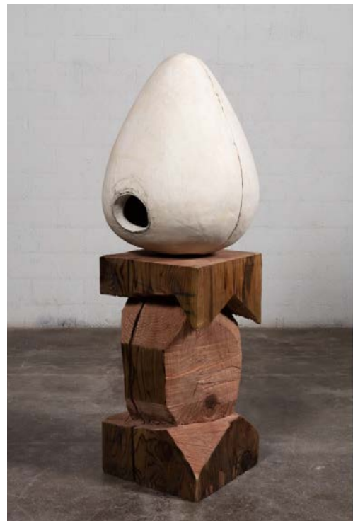
8. Thomas Houseago, Untitled (Egg) , 2015 Tuf-Cal, chanvre, fer à béton, bois, mine de plomb, crayons de couleur 181,6 x 66 x 66 cm Courtesy de l'artiste, Los Angeles © Thomas Houseago © ADAGP, Paris, 2019 Photo : Fredrik Nilsen Studio