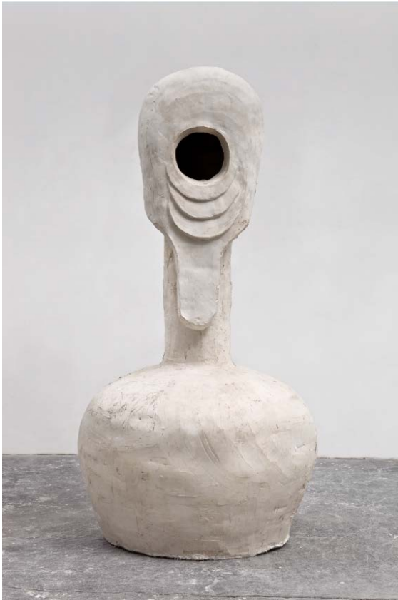
5. Thomas Houseago, Bottle Head , 2010 Tuf-cal, chanvre, fer à béton 195,6 x 99 x 94 cm Pinault Collection © Thomas Houseago © ADAGP, Paris, 2019