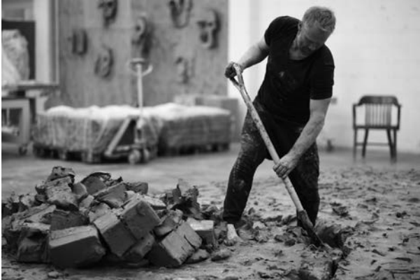
15. Thomas Houseago, Cast Studio (stage, chairs, bed, mound, cave, bath, grave) , 2018 Tuf-Cal, chanvre, fer à béton 124,5 x 538,5 x 309,9 cm