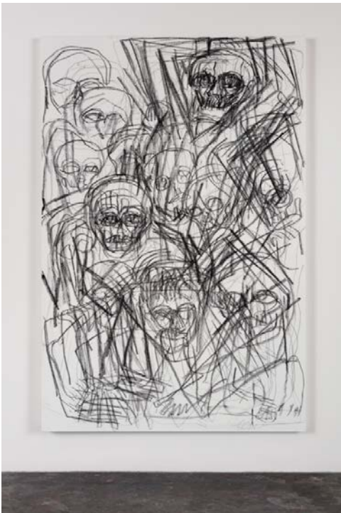
11. Thomas Houseago, Somatic Painting (Crowd) , 2018 Mine de plomb, charbon sur toile 274,3 x 182,9 x 5,4 cm Courtesy de l'artiste, Los Angeles © Thomas Houseago © ADAGP, Paris, 2019 Photo : Fredrik Nilsen Studio