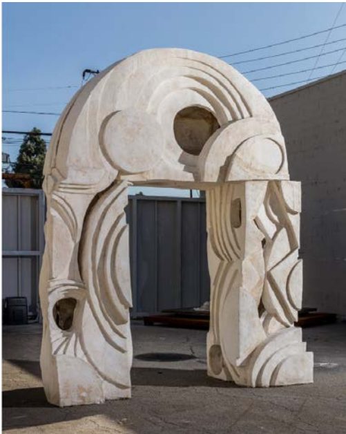
9. Thomas Houseago, Untitled (Moon Gate) , 2015 Tuf-Cal, chanvre, fer à béton 363,2 x 297,2 x 121,9 cm Courtesy de l'artiste, Los Angeles © Thomas Houseago © ADAGP, Paris, 2019 Photo : Fredrik Nilsen Studio