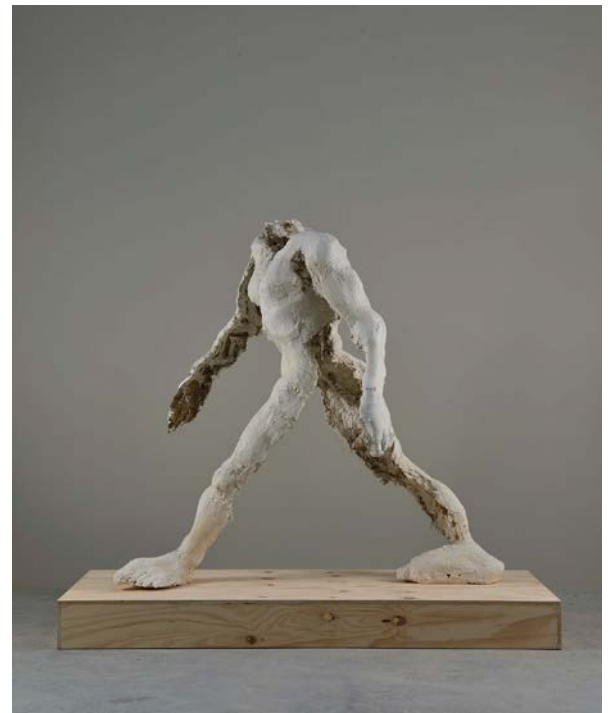
2. Thomas Houseago, Walking Man , 1995 Plâtre, fer, jute 150 x 61 x 88 cm Collection Elsa Cayo, Bruxelles © Thomas Houseago © ADAGP, Paris, 2019