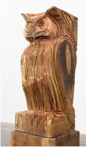
13. Thomas Houseago, California , 2018 Séquoia, charbon, mine de plomb, crayons de couleur, pastel 189,9 x 60,3 x 60,3 cm © Thomas Houseago © ADAGP, Paris, 2019