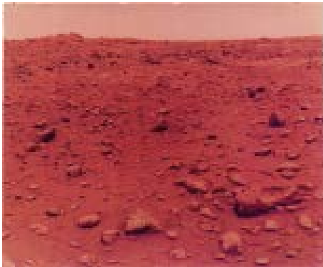
11. NASA, Viking Lander 1, First Colour Photo Taken on Mars 21 Juillet 1976, 61 x 69,9 x 0,5 cm