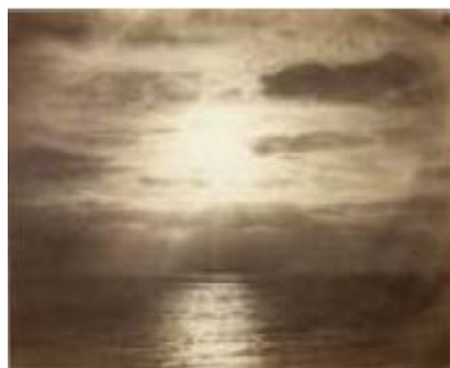
2. Gustave Le Gray (1820-1884), Effet de soleil dans les nuages – Océan, 1856-57, Musée des Beaux-Arts de Troyes (dépôt du MUCEM)