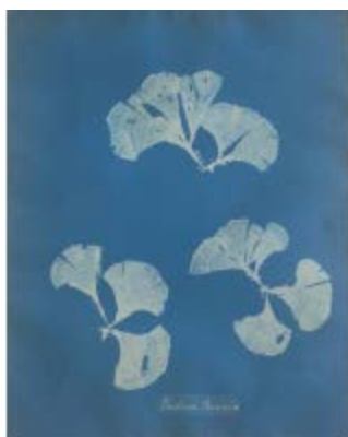
1. Anna Atkins (1799-1871), Padina Pavonia 1843-1853, Cyanotype, 35 x 28 cm Paris, bibliothèque du Muséum d'histoire naturelle