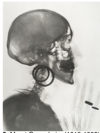
8. Meret Oppenheim (1913-1985), Radiographie du crâne de M. O. 1964 ( Röntgenaufnahme des Schädels M. O.), Collection particulière, courtesy : Peter Freeman, Inc.