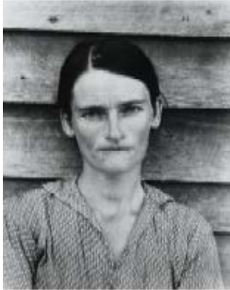
5. Walker Evans (1903-1975), Alabama Tenant Farmer Wife 1936, 24,5 x 19,5 cm, Londres, Victoria and Albert Museum