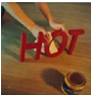
9. Bruce Nauman (1944-), Waxing Hot 1970, Kunstmuseen Krefeld, 51 x 51,4 cm Bruce Nauman © Adagp, Paris 2016 © Kunstmuseen Krefeld