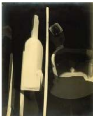
3. Man Ray (1890-1976), Sans titre (Radiographie) 1925, 50,5 x 40,3 cm, Paris, Centre Pompidou- Musée national d'art moderne - Centre de création