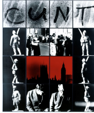
12. Gilbert & Georges (1943- et 1942-), Cunt 1977, 241 x 201 cm Gilbert et George