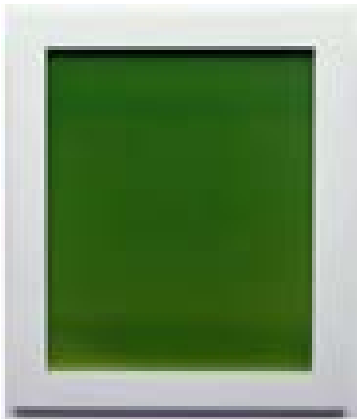
13. James Welling (1951-), Dégradé ISTJ 1991, 71,4 x 60,6 cm Paris, Centre National des arts plastiques © James Welling