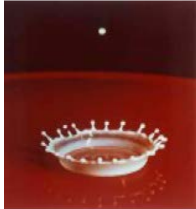
6. Harold E. Edgerton (1903-1990), Milk Drop Coronet 1957, 46,5 x 33,9 cm Centre National des Arts Plastiques (Fonds national d'art contemporain)