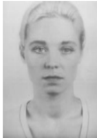
14. Thomas Ruff (1958-), anderes Portrait 122b-15 1994, 205 x 155 cm Collection particulière Thomas Ruff © ADAGP, Paris 2016