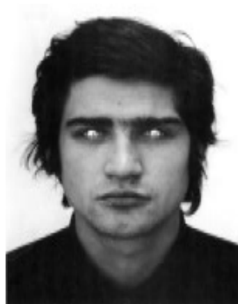
10. Giuseppe Penone (1947-), Rovesciare I propri occhi progetto 1970, 27,1 cm x 20,1 cm chacun, Collection particulière © Archivio Penone, © ADAGP, Paris 2016