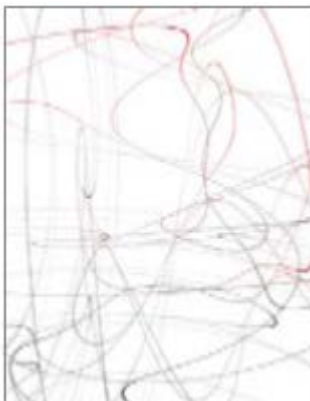
15. Thomas Ruff (1958-), Zycles 7044 2008, 306 x 236 cm Collection particulière Pour l'oeuvre de groupe "Sterne" (Stars)