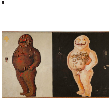
Victor Brauner, Force de concentration de Monsieur K. , 1934 Celluloid, fil de fer, huile sur toile (1,485 m x 2,95 m)