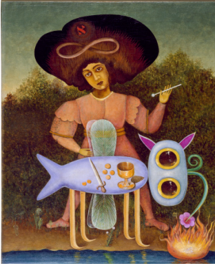
Victor Brauner, Le Surréaliste , janvier 1947 Huile sur toile (60 x 45 cm) Crédit photographique : The Solomon R. Guggenheim Foundation, Peggy Guggenheim Collection, Venice, 1976 © Adagp, Paris, 2020