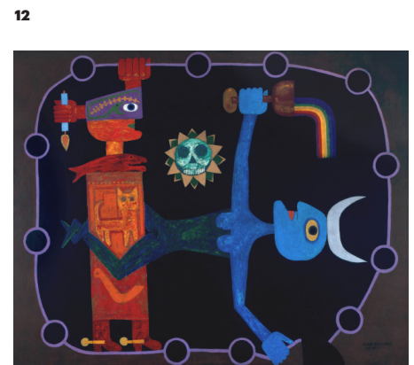
Victor Brauner, Cérémonie , mai 1947 Huile sur drap de coton rentoilé (190 x 238 cm) Fonds de dotation Jean-Jacques Lebel et Hopi Lebel Victor Brauner © Adagp, Paris 2020 Jean-Louis Losi © Adagp, Paris 2020