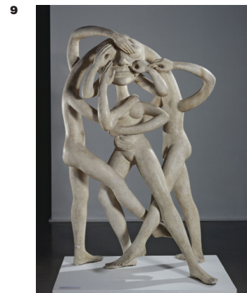
Victor Brauner, Congloméros , 1945 Plâtre (H 180 x L 117 x P 75 cm) Crédit photographique : Paris Musées / Musée d' Art Moderne de Paris © Adagp, Paris, 2020