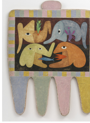
Victor Brauner, Le tableau à quatre pattes , 1965 Collection MASC musée d'art moderne et contemporain des Sables d'Olonne © Adagp, Paris, 2020