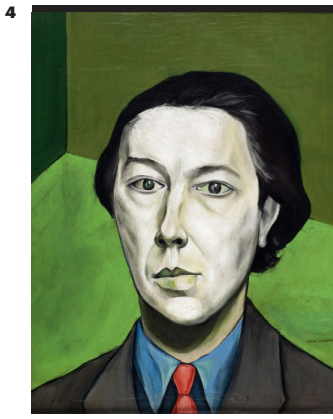
Victor Brauner, Portrait d'André Breton , 1934 Huile sur toile (61 x 50 cm) Musée d' Art Moderne de Paris Crédit photographique : Paris Musées / Musée d' Art Moderne de Paris © Adagp, Paris, 2020