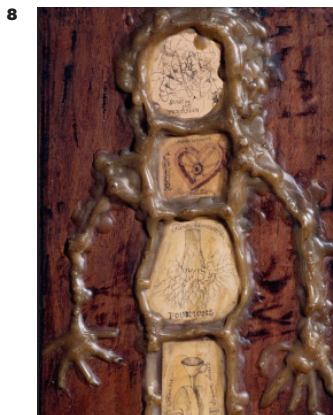
Victor Brauner, Homme idéal , 1943 Cire, collé, peinture (0,37 m x 0,165 m)