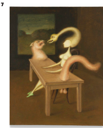
Victor Brauner, Fascination , 1939 Huile sur toile (87,63 cm x 77,47 cm x 5,72 cm) Crédit photographique : San Francisco Museum of Modern Art, Anonymous gift Photo Katherine Du Tiel © Adagp, Paris, 2020