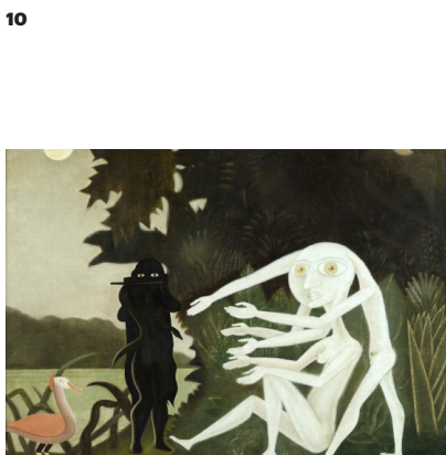
Victor Brauner, La rencontre du 2 bis rue Perrel , 1946 Huile sur toile (85 x 105 cm) Don de la Société des Amis du Musée d'Art Moderne de la Ville de Paris en 1988, Musée d'Art Moderne de Paris