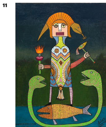
Victor Brauner, Jacqueline au grand voyage , 1946 Huile sur toile (46 x 38 cm)