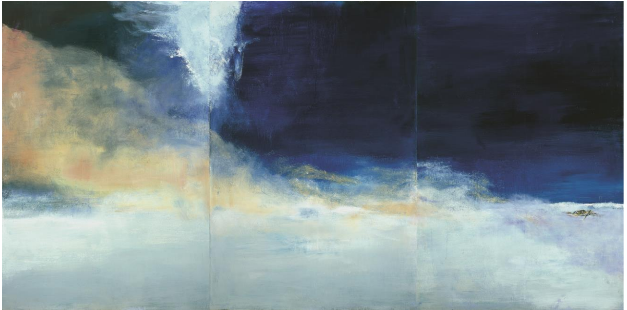
7. Zao Wou-Ki, Le vent pousse la mer , 2004 Huile sur toile 194,5 x 390 cm Collection particulière Zao Wou-Ki © ADAGP, Paris, 2018