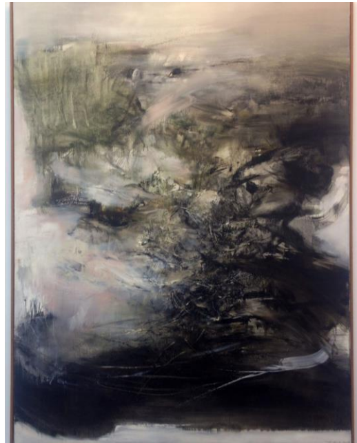
5. Zao Wou-Ki, 06.01.68 , 1968 Huile sur toile 260 x 200 cm Musée d'Art moderne de la Ville de Paris, achat en 1971 Zao Wou-Ki © ADAGP, Paris, 2018