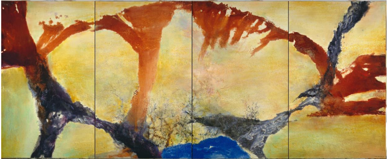
10. Zao Wou-Ki, Décembre 89 – février 90 - Quadriptyque, 1989-1990 Huile sur toile 162 x 400 cm Collection particulière Zao Wou-Ki