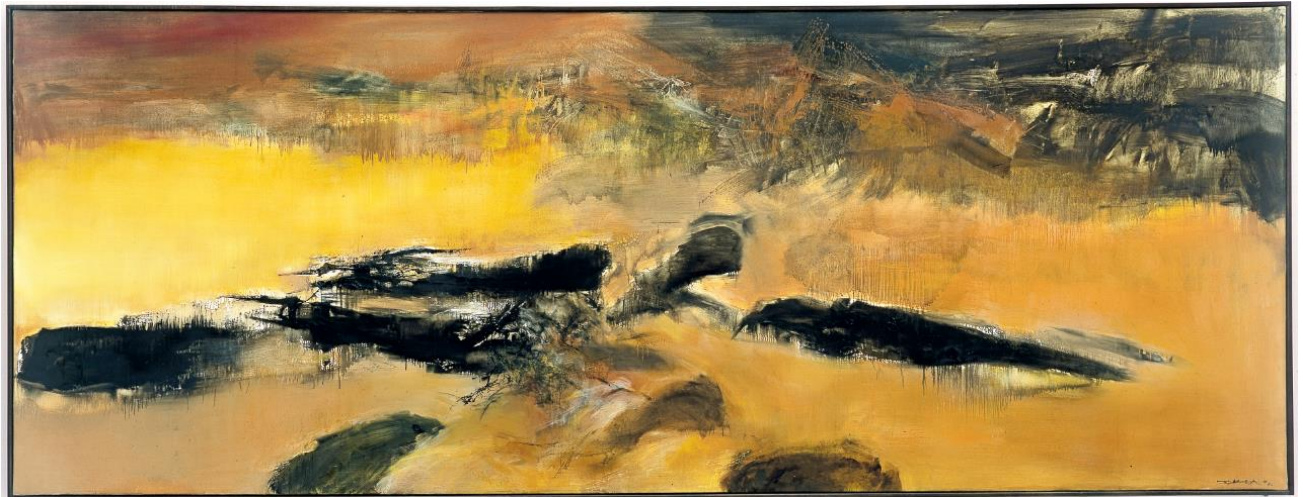
11. Zao Wou-Ki, 10.09.72 - En mémoire de May (10.03.72) , 1972 Huile sur toile 200 x 525.7 cm Don de l'artiste à l'Etat en 1973 Attribution au Centre Pompidou, Musée national d'art moderne/CCI, Paris Zao Wou-Ki © ADAGP, Paris, 2018