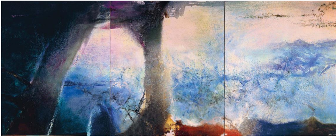
1. Zao Wou-Ki, Hommage à Claude Monet , février-juin 91 – Triptyque, 1991 Huile sur toile 194 x 483 cm Collection particulière Zao Wou-Ki © ADAGP, Paris, 2018