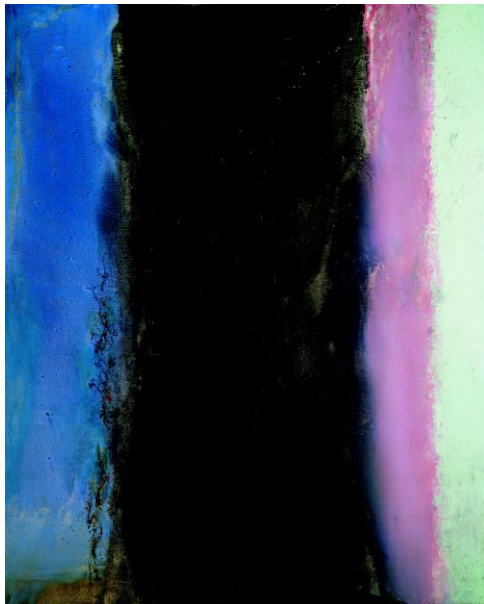
2. Zao Wou-Ki, Hommage à Matisse I - 02.02.86I, 1986 Huile sur toile 162 x 130 cm Collection particulière Zao Wou-Ki © ADAGP, Paris, 2018