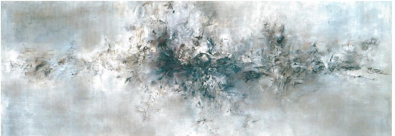
6. Zao Wou-Ki, Traversée des apparences , 1956 Huile sur toile 97 x 195 cm Collection particulière Zao Wou-Ki © ADAGP, Paris, 2018