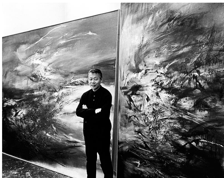
14. Sidney Waintrob, Zao Wou-Ki dans son atelier de la rue Jonquoy en 1967, devant les peintures 29.09.64 et la première version de 21.09.64, 1967 Zao Wou-Ki © ADAGP, Paris 2018