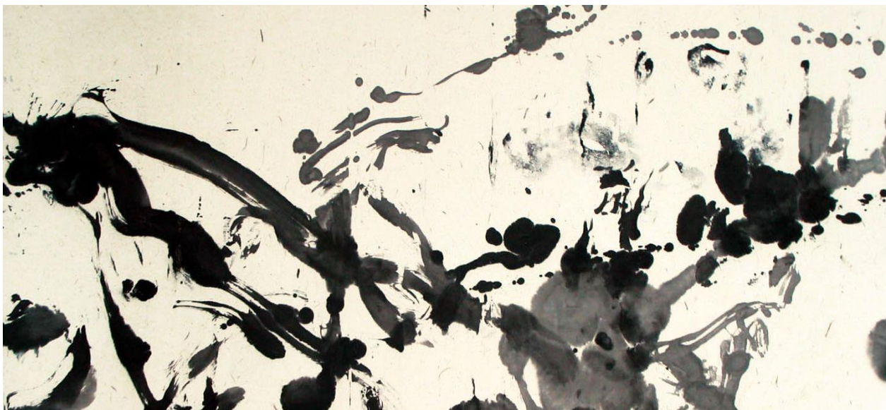
12. Zao Wou-Ki, Sans titre , 2006 Encre de Chine sur papier 97 x 180 cm Collection particulière Zao Wou-Ki © ADAGP, Paris, 2018