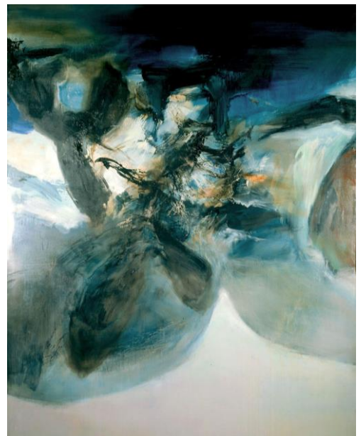
9. Zao Wou-Ki, 01.10.73 , 1973 Huile sur toile 260 x 200 cm Collection particulière Zao Wou-Ki © ADAGP, Paris, 2018