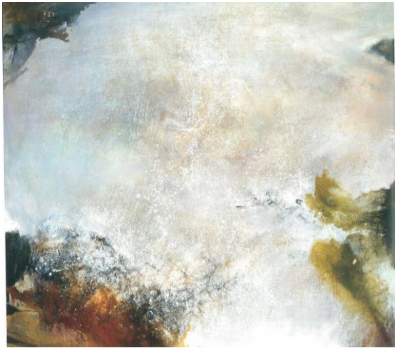
4. Zao Wou-Ki, 05.03.75 – 07.01.85, 1975-1985 Huile sur toile 250 x 260 cm Collection particulière Zao Wou-Ki © ADAGP, Paris, 2018