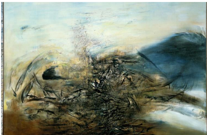
8. Zao Wou-Ki, Hommage à Edgar Varèse - 25.10.64 , 1964 Huile sur toile 255 x 345 cm Donation Françoise Marquet-Zao, 2015 Musée cantonal des beaux-arts, Lausanne Zao Wou-Ki © ADAGP, Paris, 2018