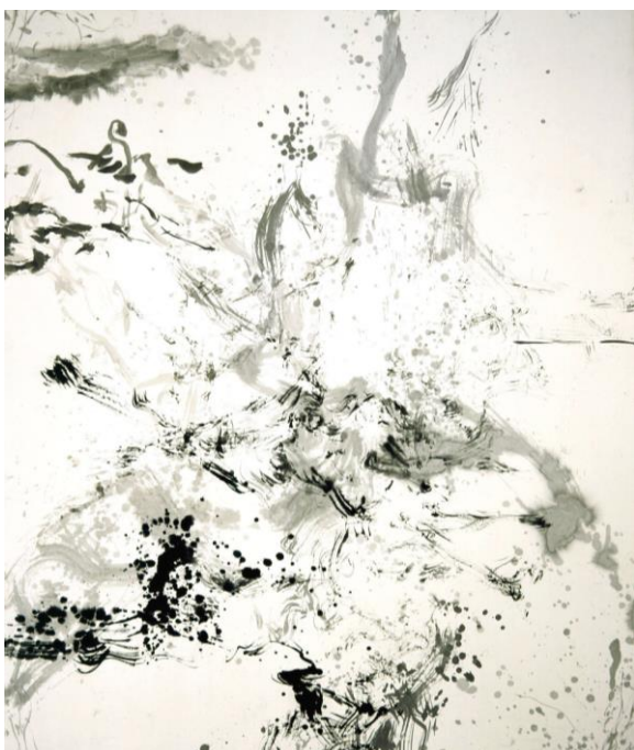
13. Zao Wou-Ki, Sans titre , 2006 Encre de Chine sur papier 274,5 x 213,5 cm Collection particulière Zao Wou-Ki © ADAGP, Paris, 2018